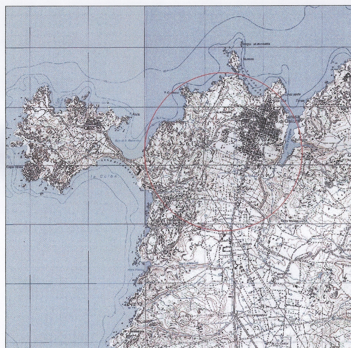
Starfcio IGM 25:000 - Foglio 411150 - Santa Teresa di Gallura